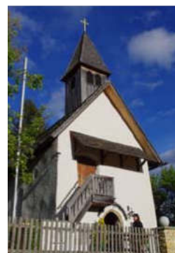
Die 6 Kirchen des Pfarrgemeindevorstands Lieser-Maltatal: Die Kirchen der Toleranzgemeinden Dornbach, Eisentratten und Trebesing, und der Predigtstellen Oberbuch, Gmünd und St. Georg in Altersberg.

Vertrauen auf Gott – und dann schauen, was daraus wird. Es braucht neue Anstellungsformen mit geistlicher Beauftragung, verschiedene Zugänge ins Pfarramt und auch neue Gemeindeformen – natürlich nicht an den zuständigen kirchlichen Gremien vorbei. Es gibt so viele Möglichkeiten, neu auf Menschen zuzugehen: von der sozialmissionarischen Jugendarbeit bis zu sportlich und musikalisch geprägten Angeboten. Es geht darum, Hoffnungsorte zu schaffen, Hoffnungsmomente erlebbar zu machen und als Hoffnungsmenschen zu denen zu gehen, die Gott ganz nahe bei sich haben will. Dann entsteht und wächst „Lebendige Gemeinde“.