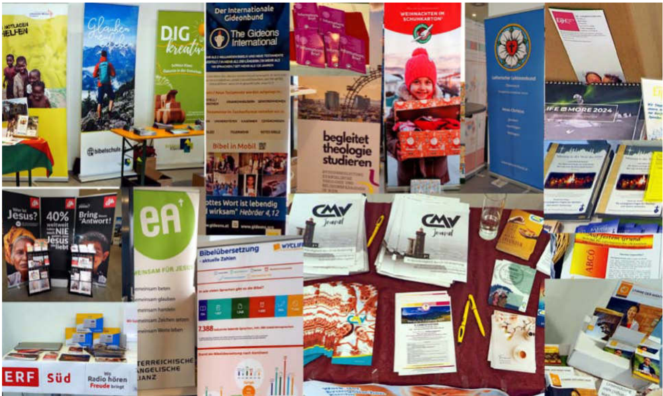
Aussteller (im Uhrzeigersinn von links oben): Liebenzeller Mission, Schloss Klaus, DIG, Die Gideons, Begleitet Theologie studieren, Weihnachten im Schuhkarton, LUTMIS, EijH, Evangelische Karmelmission, ABCÖ, Stimme der Märtyrer, CMV, Christusbewegung, Wycliff, Evangelische Allianz, ERF-Süd, OM.