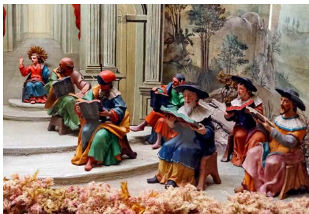
Der zwölfjährige Jesus im Tempel, J.G. Schwanthaler, ca. 1770, Pfarrkirche Altmünster

Gemeinschaft von Menschen, die aus der Liebe Gottes leben und diese Liebe weitergeben. So werden verhärtete Fronten aufgebrochen, neue Brücken gebaut und einsturzgefährdete Brücken instandgesetzt und stabilisiert. Dann muss niemand mehr aus Angst, oder aus Geiz oder aus Neid so viel haben, wie er nur kriegen kann, sondern kann seine Gaben, sein Geld und seine Zeit für die zur Verfügung stellen, die das alles brauchen und damit ihnen dienen. So können Gerechtigkeit und Barmherzigkeit sich immer weiter ausbreiten.