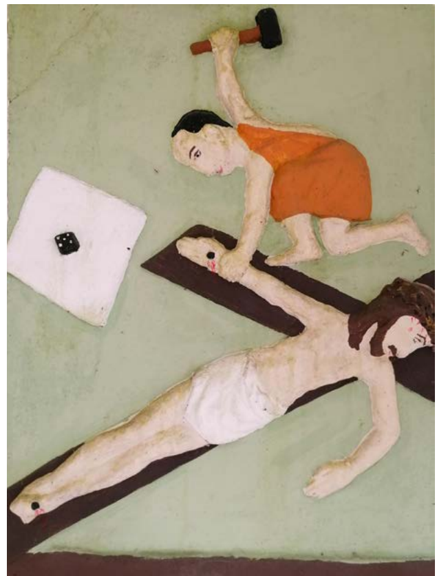
Elfte Kreuzwegstation, Johann Kraml, 1966, Kalvarienberg in Julbach im Mühlviertel.

Die Jünger kommen aus dem Staunen nicht heraus. Treffend hat es der Apostel Johannes formuliert: „ Sehet, welch eine Liebe hat uns der Vater erwiesen, dass wir Gottes Kinder heißen sollen – und wir sind es auch “ (1. Joh. 3, 1).