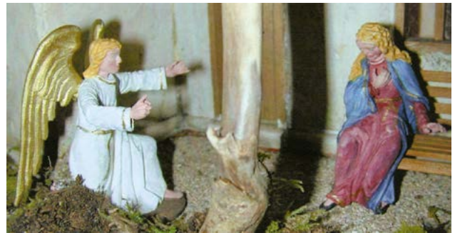
Verkündigung, Ebenseer Hauskrippe, Bad Ischl

Gott spricht, der Mensch hört, vertraut, gehorcht. Gott bringt die Erlösung zum Ziel. Gott gibt, der Mensch empfängt. Damit haben wir eine solide, sichere und krisenfeste Grundlage unseres Glaubens: Wir leben von dem, was Gott für uns getan hat und tut.