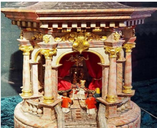
Beschneidungstempel, Dr. Stadler Krippe, Museum Ebensee

Was uns als Christen viel größere Sorgen macht als der Stillstand in der Gesellschaft, ist der Stillstand, ja die Resignation in der Kirche.