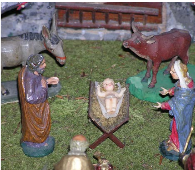
Heilige Familie, Christi Geburt, Krippe Loidl Fritz sen., Ebensee

In den Religionen berühren die Götter nur im Rahmen eines göttlichen Besuches für eine sehr kurze Zeit den Erdboden, um gleich wieder in den Götterhimmel zurückzukehren. Aber Jesus, der Sohn Gottes, erlebt alles, was jeder Mensch sonst auch erlebt an Glück und Not, an Freude und Leid. Alles, was Menschen durchmachen müssen, hat der Sohn Gottes selbst durchgemacht.